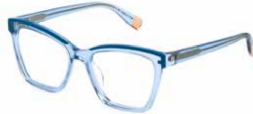
FURLA Ecken, Kanten sowie raffinierte Details an der Front führen einen unverwechselbaren Look vor Augen.