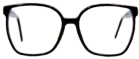
WÖRTHERSEE Volltreffer! Bühne frei für die 70er Jahre. Die weiten, quadratischen Rahmen passen perfekt zu jedem Retro-Look.

Die Marke ist made in Austria, trotzdem im heimischen Markenvergleich preiswert. Jeder Kauf einer Scharfsinn-Fassung stärkt eigenständige, unabhängige Optikerbetriebe und belebt auch die heimische Wirtschaft.