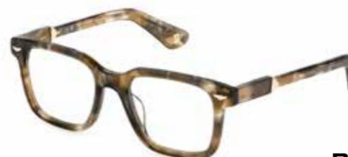
POLICE Buongiorno! Exklusives, marmoriertes Acetat trifft auf markante Proportionen in italienischem Flair.