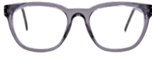
MUR Alles im Flow – der fließende Übergang in die ovale Form harmonisiert mit rundlichen wie eckigen Gesichtern.

KOSTENLOSER SEHTEST Wir bieten Ihnen einen kostenlosen Sehtest mit fachkundiger Beratung, damit Sie immer mit den richtigen Gläsern unterwegs sind. Unabhängig vom Sehtest sollte eine regelmäßige Überprüfung des allgemeinen Gesundheitszustandes der Augen bei einem Augenarzt erfolgen.